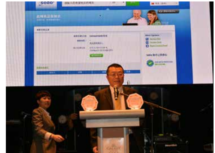
ICANN新通用頂級網域項目最成功優質網域名稱資源拍賣會順利結束——5小時內拍賣總金額達到18.4萬美金。