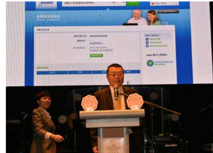
ICANN新通用頂級域名項目最成功優質域名資源拍賣會順利閉幕——5小時內拍賣總額大18.4萬美金。