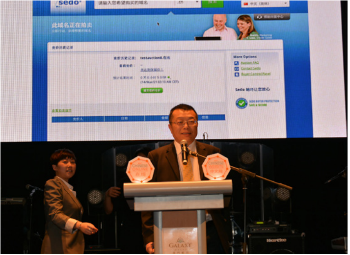
ICANN新通用顶级域项目最成功优质域名资源拍卖会顺利闭幕——5小时内拍卖总额达18.4万美金。